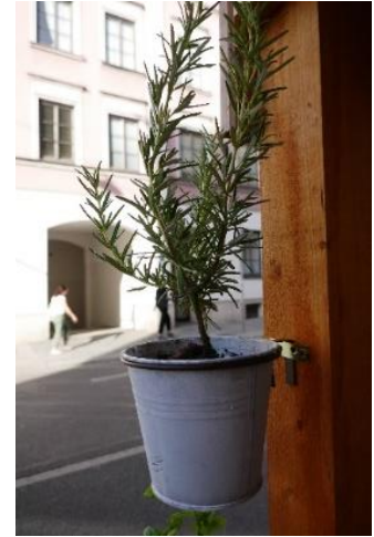
Abbildung 4 Bepflanzung - hier sogar essbar - mit Rosmarin