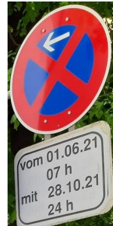
Abbildung 2 Haltverbot mit Zeitzusatz