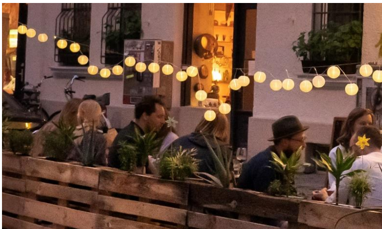
Abbildung 5 Eine Beleuchtung mit kleinen Lichterketten ist möglich