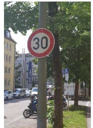
Abbildung 1 Parklets sind grundsätzlich an Straßen mit Tempo 30 möglich