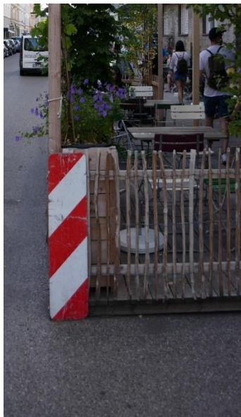
Abbildung 3 Absicherung mit Leitplatten

Die Gestaltung der Parkletfläche ist zum Großteil Ihnen überlassen, die Vorgaben zum Standort und der Gestaltung (siehe Nutzungskonzept) sind zu beachten. Darüber hinaus werden im Genehmigungsbescheid insbesondere folgende Vorgaben gemacht: