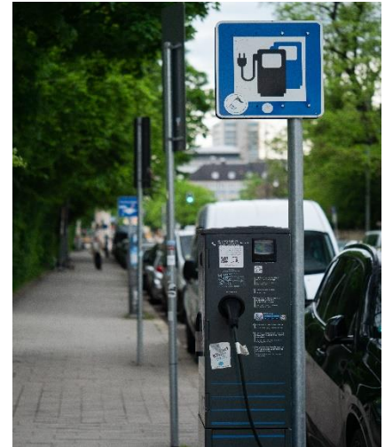
Abbildung 2 Auf Elektroladeplätzen haben Parklets leider nichts zu suchen

Das Parklet darf folgende Einrichtungen nicht beeinträchtigen oder verdecken: