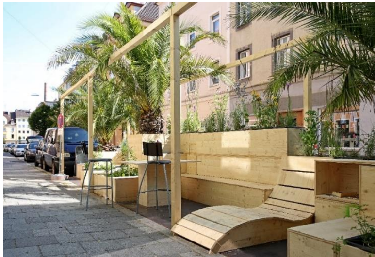
Abbildung 6 So könnte ein fertiges Parklet aussehen

Die Verwaltung benötigt im Rahmen des Pilotprojekts nach vollständiger Vorlage der Unterlagen grundsätzlich ungefähr 4-6 Wochen bis zum Ausstellen der Genehmigung. Dies ist auch abhängig vom Sitzungskalender des örtlichen Bezirksausschusses.