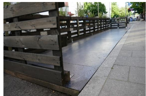
Abbildung 6 Bodenplatte mit lückenlosem Abschluss

Dabei soll der Fokus auf einer Gestaltung für alle Generationen liegen (z.B. nicht ausschließlich zum Spielen für Kinder) und möglichst barrierefrei sein.