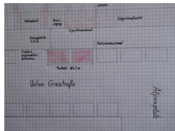
Abbildung 4 Beispiel für einen Umgebungsplan

Dieser Plan und die Bilder konzentrieren sich auf Umgebung des Parklets, nicht auf die Gestaltung auf der Parkletfläche selbst. Dieser Plan kann händisch gezeichnet und mit Maßangaben versehen sein.