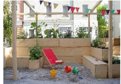
Abbildung 3 Eine Pergola dient als Rankhilfe und stellt keine Überdachung des Parklets dar